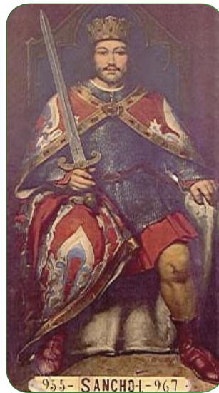
Figura 1. Ilustración de Sancho I el Craso.

La ya octogenaria reina Toda de Navarra acogió a Sancho I con la idea de recuperar su trono (y mantener su influencia sobre el reino de León), no sin antes poner en marcha un plan para devolver a su nieto “la primitiva astucia de su ligereza”. La reina Toda mantenía relaciones de parentesco con el califato cordobés, por lo que no dudó en solicitar ayuda para curar a su nieto así como cooperación militar para reintegrarlo a su trono. Abd-al-Rahmán III aceptó la propuesta, a cambio de que, tras la reentronización, le fueran entregadas 10 fortalezas fronterizas del margen del Duero. El califa envió a Navarra al famoso médico judío Hasday ibn Saprut, quien iba a ocuparse del tratamiento del craso Sancho. Pero, para ello, deberían hacer un viaje hasta la capital del califato, Córdoba; un trayecto lleno de aventuras tal y como se narra en la novela de Ángeles de Irisarri El viaje de la reina (3) .